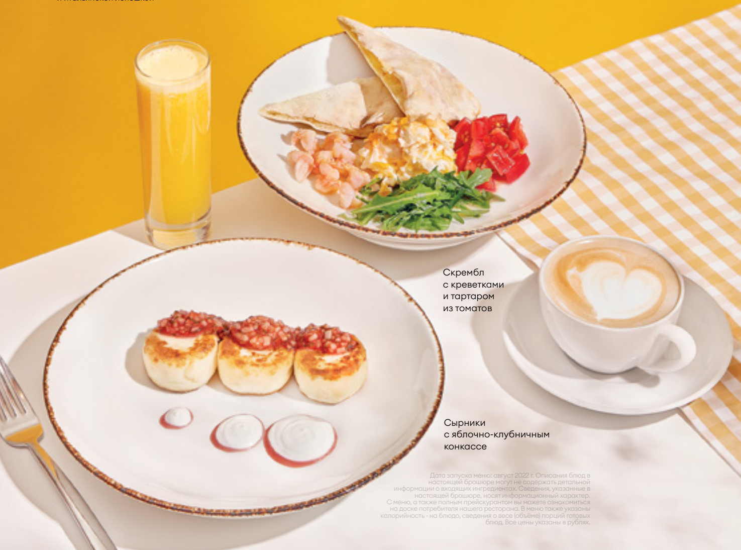
Скрембл с креветками и тартаром из томатов

Блюда из яиц подаём с листьями салата и итальянской лепёшкой